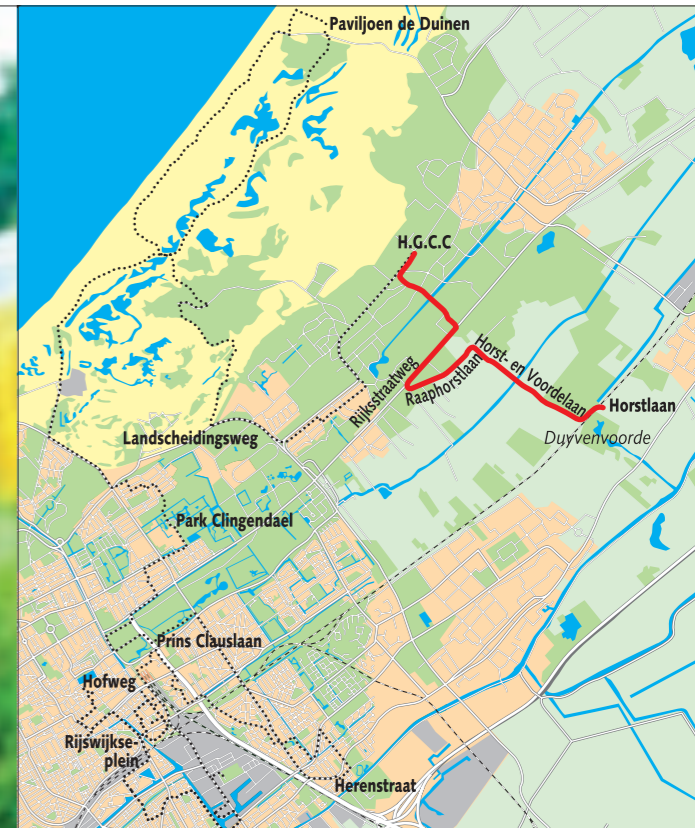
De redactie van deze krant loopt deze zomer door de stad en de buurgemeenten, op zoek naar bijzondere verhalen. We begonnen op de Hofweg en zijn nu beland op Brandneteleiland van prof. Y. Lupardi. Op de foto: Laatste aanwijzing vlak voor de vondst van de schat. infografiek Hans Fresen

Wie nu en dan voor zijn plezier de bosjes indrukt om er grote ontdekkingen te doen, wordt niet altijd serieus genomen. Dat is niet terecht. Heel gewone bosjes verbergen veel vaker geheimen dan menigeen weet. Alleen de echte liefhebbers weten die geheime plekjes te vinden, met hulp uit de ruimte.